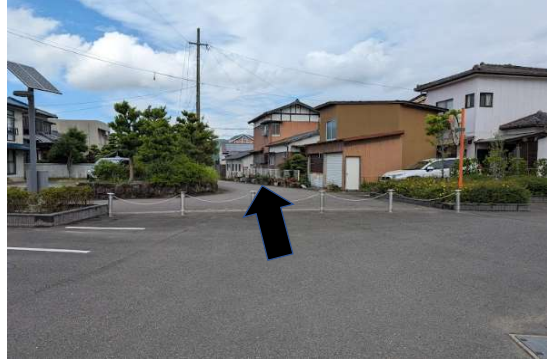
バス出口(出口より直進となります)