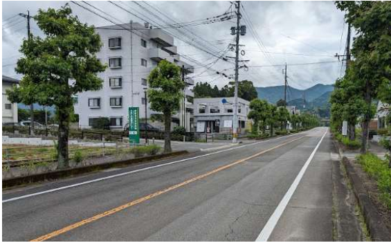
中央体育館バス入り口