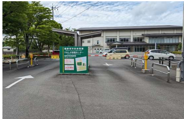
有料駐車場(中央体育館利用者は無料になります)