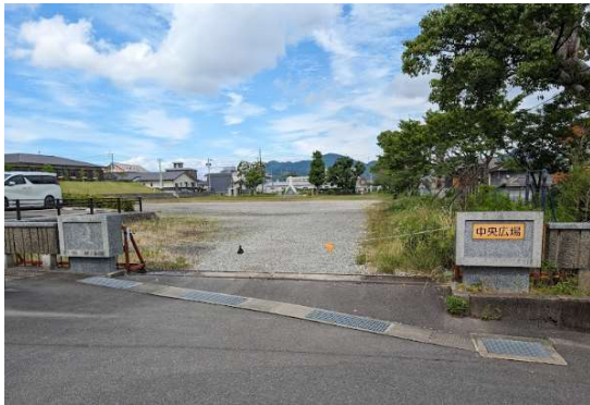
体育館南側出入り口(砂利駐車場)